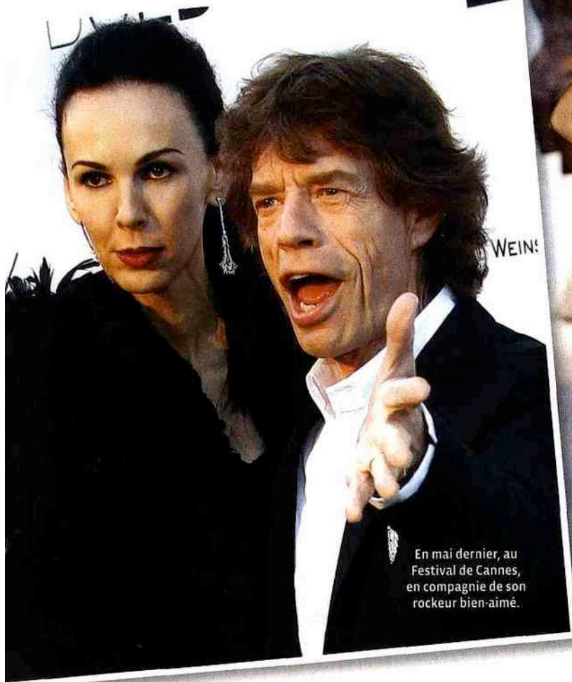
En mai dernier, au Festival de Cannes, en compagnie de son rockeur bien-aimé.