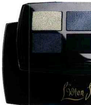
Parmi les quatre produits de sa minicollection, une palette d'ombres dans un boîtier signé de son nom (46 €).

la jeune femme qui y reçoit aujourd'hui la presse internationale, et qui déploie à votre entrée dans sa suite une incroyable silhouette de liane : 1,93 mètre sous la toise ! Auquel il faut ajouter quelques centimètres griffés Louboutin à ses pieds. Même pour un homme de taille normale, de quoi vous faire passer pour un Pygmée en goguette ! « J'ai toujours été grande, explique-t-elle. A 12 ans, je mesurais déjà plus de 1,80 mètre. J'aurais pu vivre cela comme un drame, et c'est vrai que les enfants de l'école n'étaient pas tous tendres avec moi, mais ma mère, qui est toute petite, me disait continuellement : "Quelle chance tu as, toi, d'être grande !" et je crois que ce regard